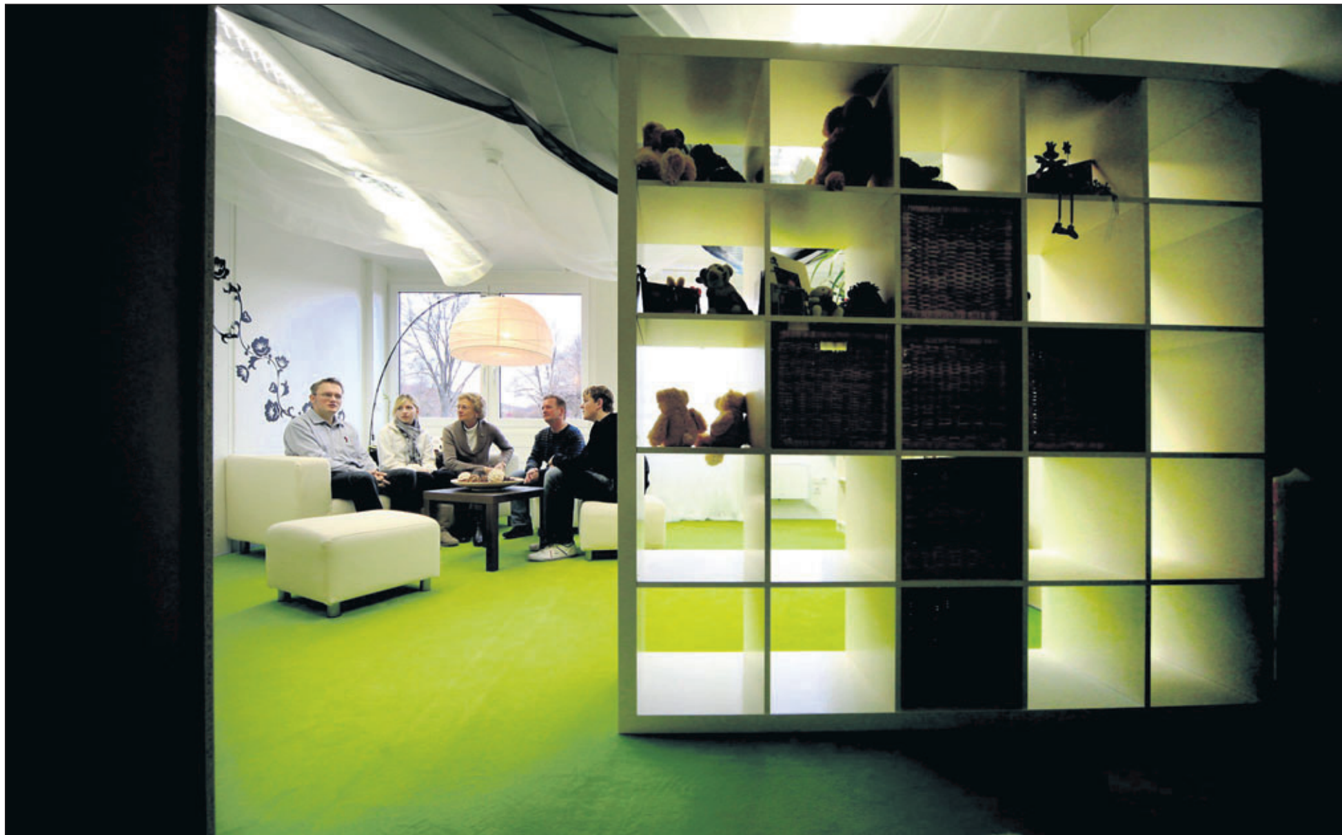
Der Raum der Stille.

Mit der Landesgartenschau an der Rems zwischen Waiblingen und Schorndorf wird es – zumindest vorerst – nichts: 2016 ist Öhringen dran, 2018 Lahr. So hat der Ministerrat entschieden. Um eine Landesgartenschau hatten sich 18 Kommunen beworben. Eine Fachkommission bewertete die Bewerbungen und beurteilte die Konzepte. Eine Landesgartenschau zu veranstalten, gilt in mehrfacher Hinsicht als reizvoll: Es gibt bis zu fünf Millionen Euro Zuschuss vom Land, es lockt Imagegewinne.